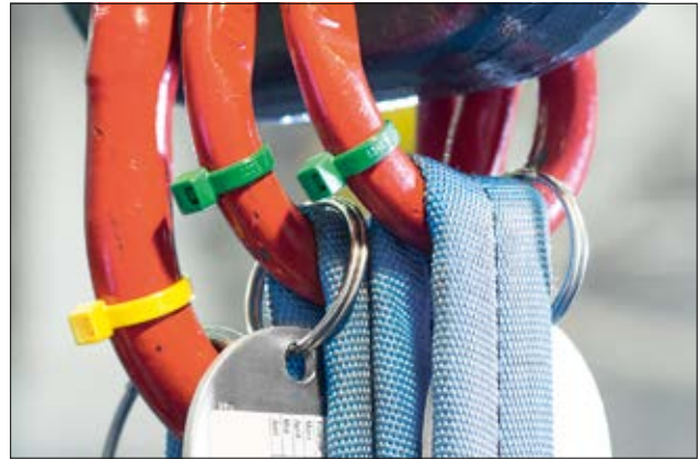
Kabelbinder der T-Serie - ideal zur farblichen Kennzeichnung.