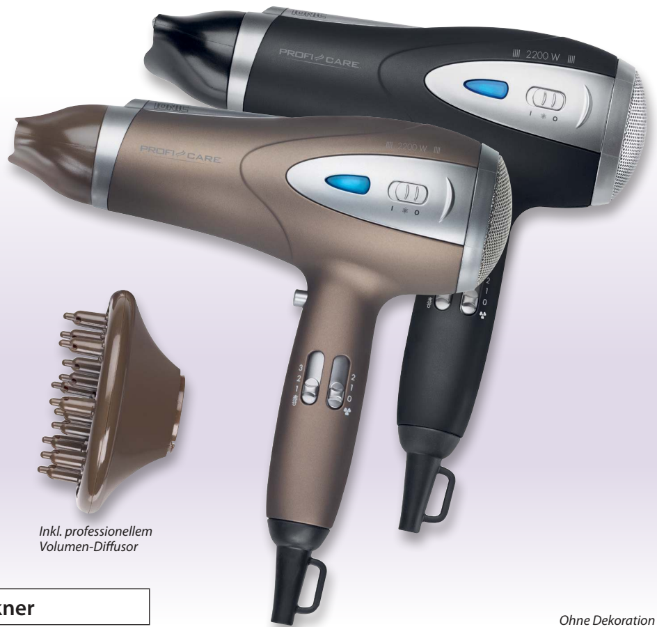
Inkl. professionellem Volumen-Diffusor