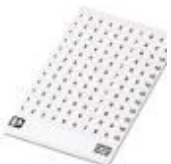
Kennzeichnungskarte, Karte, bestellbar: kartenweise, weiß, beschriftet nach Kundenangaben, Montageart: kleben, für Klemmenbreite: 5,2 mm, Schriftfeldgröße: endlos x 3,8#mm

Kennzeichnungskarte - SK 3,8 REEL P5,2 WH CUS - 8199989