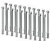
Optionale Befestigungsschraube, ohne Rändel für beengte Einbauverhältnisse, Schlitz, Länge: 40 mm, UNC 4-40 Gewinde. Lieferumfang: 1 Beutel mit 20 Schrauben