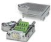
D-SUB-Stecker, 9-polig, Stift, eine Kabelzuführung unter 35°, Universaltyp für alle Systeme, Pinbelegung: 1, 2, 3, 4, 5, 6, 7, 8, 9 auf Schraubanschlussklemme

D-SUB-Busstecker - SUBCON 9/M-SH - 2761509