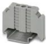
Endhalter, Breite: 9,5 mm, Farbe: grau