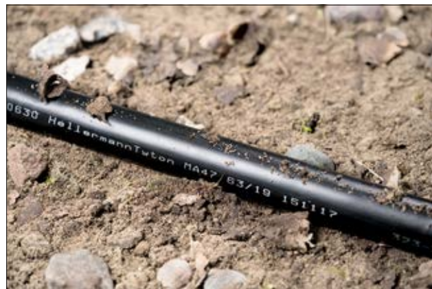
MA47 ist auf und unter der Erde einsetzbar.