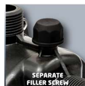
SEPARATE FILLER SCREW