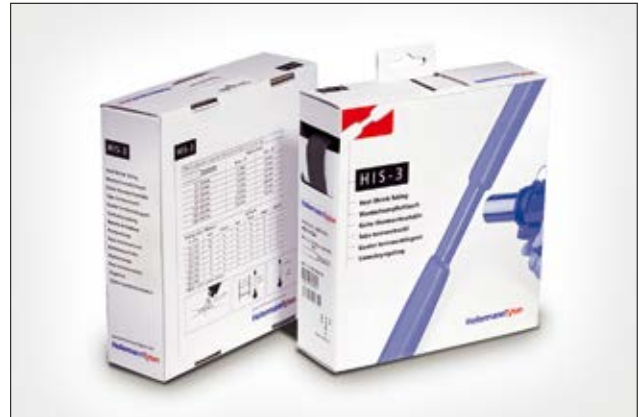
HIS-3 ist selbst bei großen Durchmesserunterschieden geeignet.