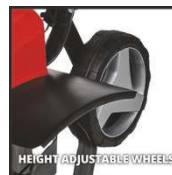
HEIGHT ADJUSTABLE WHEELS