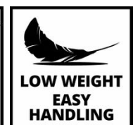
LOW WEIGHT EASY HANDLING