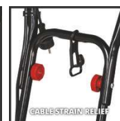
CABLE STRAIN RELIEF