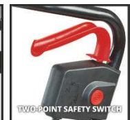
TWOPOINT SAFETY SWITCH