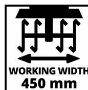
WORKING WIDTH 450 mm