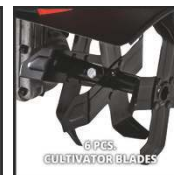
6 PCS CULTIVATOR BLADES