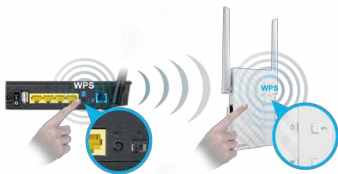
WPS- Einrichtung mit einem Klick

Der RP-N12 WLAN-Repeater besitzt leistungsstarke externe MIMO-Antennen, mit denen sich Funklöcher eliminieren lassen und der Abdeckungsbereich bestehender WLAN-Router erweitert werden kann. Im Repeater-Modus erweitert er das WLAN-Netzwerk bis in den letzten Winkel des Zuhauses — sogar in ansonsten schwer zugänglichen Bereichen. Somit ermöglicht der Repeater von jedem Punkt aus einen zuverlässigen Zugang zum Internet mit hoher Geschwindigkeit für Geräte wie bspw. Notebooks, Tablets, Smartphones, Spielekonsolen und Smart-TVs.