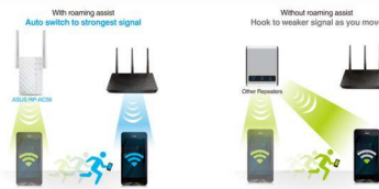
Exklusives Asus Roaming Assistent

Für die Einrichtung des RP-N12 WLAN-Repeaters benötigt man weder eine CD noch eine Maus oder Tastatur. Ein Knopfdruck auf die WPS-Taste RP-N12 sowie des Routers genügt, um die Einrichtung fertigzustellen. Somit kann der Nutzer den Repeater ganz einfach und komfortabel mit seinem Netzwerk verbinden. Erweiterte Einstellungen lassen sich ganz einfach mit einem PC per Netzwerkkabel oder aber per Smartphone APP abrufen.