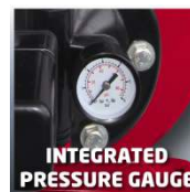
INTEGRATED PRESSURE GAUGE