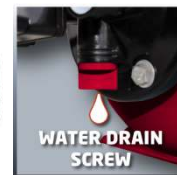
WATER DRAIN SCREW