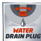
WATER DRAIN PLUG