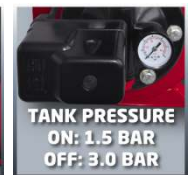
TANK PRESSURE ON: 1.5 BAR OFF: 3.0 BAR