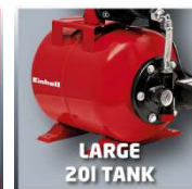
LARGE 20L TANK