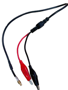
Krokodilklemmenkabel OSZILLOSKOP / SIGNALGENERATOR