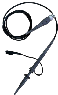
Tastkopf OSZILLOSKOP / SIGNALGENERATOR