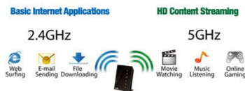
Wählbare 2.4 GHz oder 5 GHz Dual-Band Übertragung

Der externe Standfuß wird über ein mitgeliefertes Kabel (ca. 1M) mit dem ASUS USB-AC68-Adapter verbunden. Durch die rutschfeste Unterseite kann der Standfuß flexibel aufgestellt werden. Dank diesem mobilen Konzept können die Antennen auf die beste Empfangsqualität hin ausgerichtet werden.