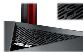
Stylishes Asus Gaming-Design

Der ASUS USB-AC68 Adapter bietet die Möglichkeit Daten zur Gegenstelle wahlweise auf dem 2.4 GHz oder auf dem 5 GHz-Band zu übermitteln. Das 2.4 GHz-Band ist sehr gut für das tägliche Surfen im Internet geeignet und bietet in der Regel eine größere Reichweite. Das 5 GHz-Band ist perfekt für ressourcenaufwendige Aufgaben wie das Streaming von Full-HD Multimediainhalten, Übertragungen von großen Datenmengen oder Online-Gaming geeignet.