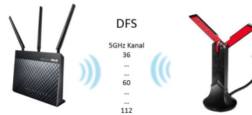
DFS (Dynamic Frequency Selection)

Der USB-AC68 WLAN Adapter verfügt über einen USB 3.0 Anschluss. Der Vorteil liegt darin, dass kein Flaschenhals in der Kommunikation am USB-Port entsteht und die Daten und voller AC-WLAN Geschwindigkeit übertragen werden können.