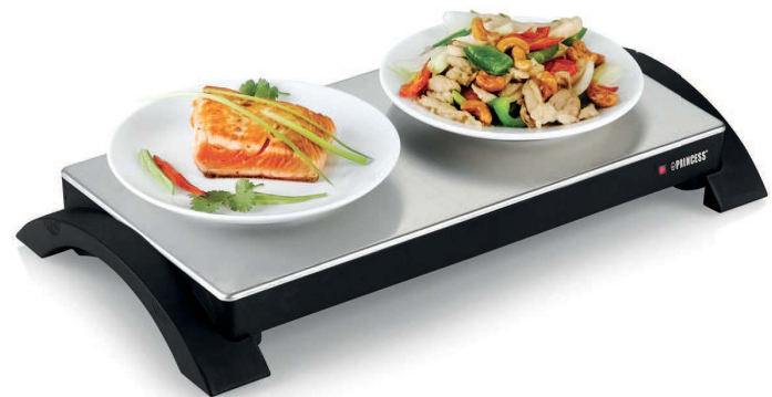
Cordless Warming Tray 01.312295.01.004

PARTS DESCRIPTION / ONDERDELENBESCHRIJVING / DESCRIPTION DES PIÉCES / TELEBESCHREIBUNG / DESCRIPCIÓN DE LAS PIEZAS / DESCRIÇÃO DOS COMPONENTES / DESCRIZIONE DELLE PARTI / BESKRIVNING AV DELAR / OPIS CZĘŚCI / POPIS SOUČÁSTI / POPIS SUČASTI