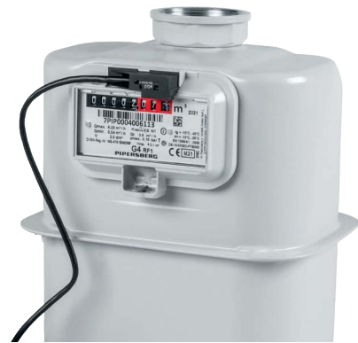
Montage an einem Gaszähler

Montieren Sie die Schnittstelle einfach selbst auf Ihrem Gaszähler. Das Gerät ist mit Gaszählern der Hersteller Elster (Kromschroder, Honeywell), Itron (Pipersberg, Actaris) und Metrix kompatibel, die über eine Vorbereitung für einen Impulssensor verfügen. Diese ist am Modulschacht und der Angabe der Impulskonstanten (z. B. 0,01 m 3 /imp.) auf dem Typenschild zu erkennen. Über einen entsprechenden Adapter (im Lieferumfang enthalten) wird der Sensor am Gaszähler angebracht. Die Erfassung erfolgt über Zählimpulse, die durch einen Magneten im Rollenzählwerk eines herkömmlichen Gaszählers erzeugt werden. Anschließend wird der Sensor mit der Schnittstelle verbunden und über die App ins Smart Home integriert – fertig!