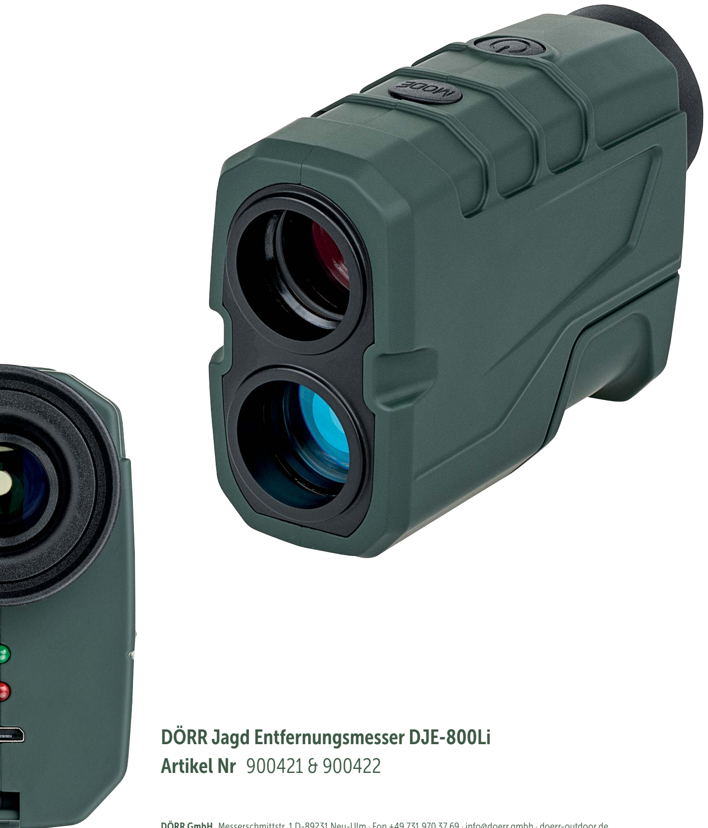
DÖRR Jagd Entfernungsmesser DJE-800Li Artikel Nr 900421 & 900422