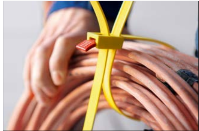
Das Bandende lässt sich beim SpeedyTie® ganz unkompliziert zurückschlaufen.