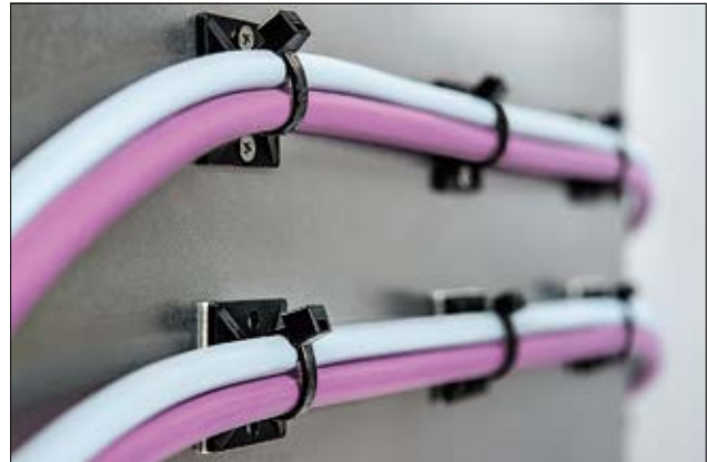
MB-Serie, quadratische Form, schraubbar/selbstklebend.