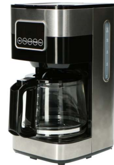
1,5l water tank with capacity indicator (for 12 cups) - Luxury stainless steel design with non-slip feet