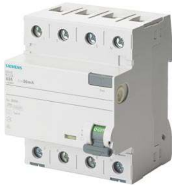
FI-Schutzschalter, 4-polig, Typ F, kurzzeitverzögert, In: 25 A, 30 mA, Un AC: 400 V