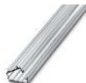
Abdeckprofil, Länge: 300 mm, Farbe: transparent