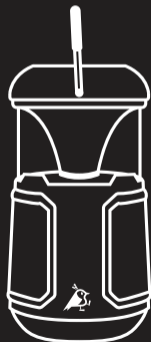
Modell: Soundbird B10