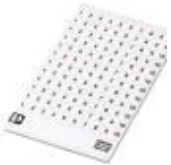
Kennzeichnungskarte, Karte, bestellbar: kartenweise, weiß, beschriftet nach Kundenangaben, Montageart: kleben, für Klemmenbreite: 5,2 mm, Schriftfeldgröße: endlos x 3,8#mm

Kennzeichnungskarte - SK 3,8 REEL P5,2 WH CUS - 8199989