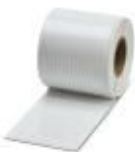
Kennzeichnungskarte, Karte, bestellbar: kartenweise, weiß, beschriftet nach Kundenangaben, Montageart: kleben, für Klemmenbreite: 5,2 mm, Schriftfeldgröße: endlos x 2,8#mm

Kennzeichnungskarte - SK 2,8 REEL P5,2 WH CUS - 8199986