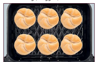
Brötchen, Baguettes, Brezeln