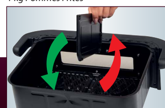
Garraum aufteilbar durch einsetzbarer Trennwand (2x 5,0 Liter)