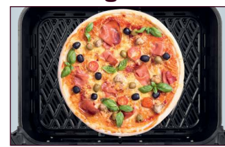
Pizza und Flammkuchen