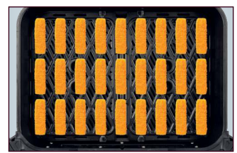
Chicken Wings, Nuggets, Fischstäbchen