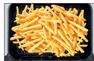
1 kg Pommes Frites