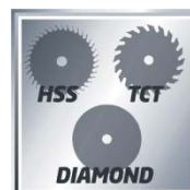
HSS TCT DIAMOND