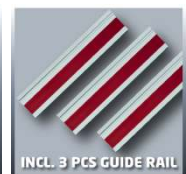
INCL. 3 PCS GUIDE RAIL