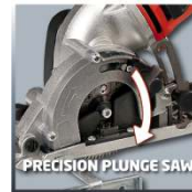
PRECISION PLUNGE SAW