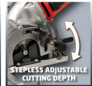
STEPLESS ADJUSTABLE CUTTING DEPTH