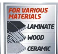
FOR VARIOUS MATERIALS LAMINATE WOOD CERAMIC