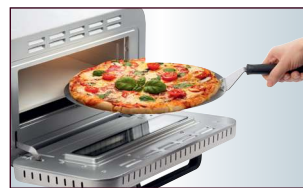
Professioneller Edelstahl Pizzaheber