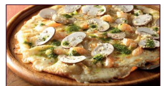
Thin Crust – extra dünn