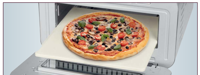
Mit echtem Pizzastein ca. 31,5 x 31,5 cm für Pizza wie aus dem Steinofen