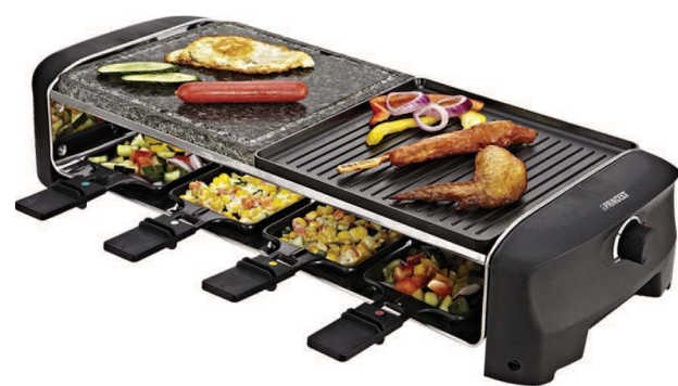
Raclette 8 Stone & Grill Party 01.162820.01.001

PARTS DESCRIPTION / ONDERDELENBESCHRIJVING / DESCRIPTION DES PIÈCES / TELEBESCHREIBUNG / DESCRIPCIÓN DE LAS PIEZAS / DESCRIZIONE DELLE PARTI / BESKRIVNING AV DELAR / OPIS CZĘŚCI / POPIS SOUČÁSTÍ / POPIS SUČASTI / ОПИСАНИЕ ЗАПЧАСТИ