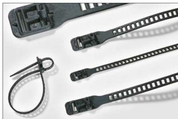
Elastisch und vielseitig einsetzbar. Die SRT- und SOFTFIX-Kabelbinder.