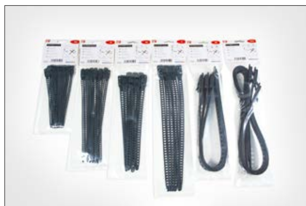
Die SOFTFIX Familie ist in praktischen Kleinverpackungen erhältlich.