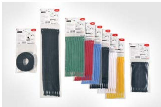
Die TEXTIE Serie ist in verschiedenen Farben und Längen erhältlich.