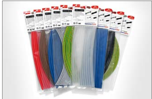
HIS-3 BAG ist in sieben Farben und vier Abmessungen erhältlich.