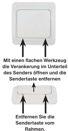
Abb.4 Demontage der Sendertaste