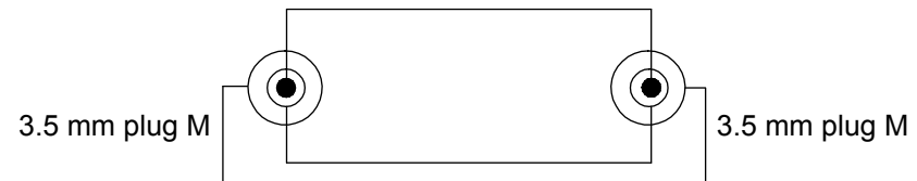
Anschlussdiagramm / Wiring diagram