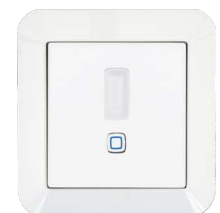
GIRA Standard 55