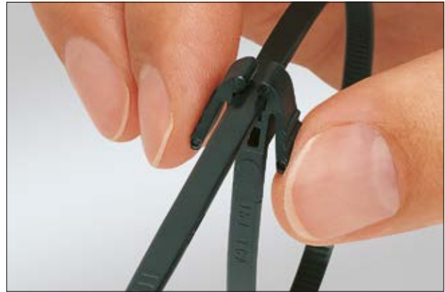
Der REZ Kabelbinder lässt sich mit nur einer Hand einfach wieder öffnen.