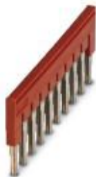
Steckbrücke, Rastermaß: 6,2 mm, Breite: 60,3 mm, Polzahl: 10, Farbe: rot

Bitte beachten Sie, dass die hier angegebenen Daten dem Online-Katalog entnommen sind. Die vollständigen Informationen und Daten entnehmen Sie bitte der Anwenderdokumentation. Es gelten die Allgemeinen Nutzungsbedingungen für Internet-Downloads. ( http://phoenixcontact.de/download )