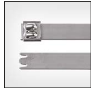
Edelstahlkabelbinder, unbeschichtet, MBT_XHS.

i Unterstützt Qualitätsprozesse in der Lebensmittelverarbeitung wie z. B. HACCP.