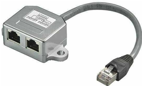
Schaltbild / Wiring diagram