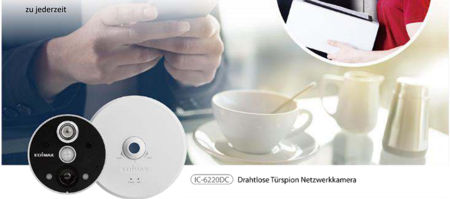
IC-6220DC Drahtlose Türspion Netzwerkkamera