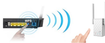
WPS– Einrichtung mit einem Klick

Dank der 802.11ac-Technologie bietet der RP-AC51 schnelle AC-WLAN-Geschwindigkeiten von bis zu 433 Mbits im 5GHz-Frequenzbereich und bis zu 300 Mbits im 2.4 GHz Frequenzband – das entspricht einer kombinierten Geschwindigkeit von 733 Mbits. Mit dieser hohen WLAN-Performance kommt der Nutzer ganz ohne Kabelverbindung in den Genuss von absolut flüssigem Online-Gaming, schnellerem Surfen im Internet sowie anderen bandbreiten-hungrigen Anwendungen.