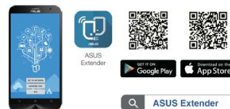
ASUS Extender App

Um die besten Ergebnisse zu erzielen muss sich der RP-AC51 innerhalb der Reichweite eines stabilen Router-Signals befinden und sollte zwischen dem Router und dem Bereich platziert werden, in dem eine bessere Signalabdeckung benötigt wird. Der Asus RP-AC51 bietet die höchste Performance, wenn er ein starkes WLAN-Signal vom Router erhält und dieses weiterleitet. Die Signalstärke kann an der Frontseite des Repeaters getrennt nach Frequenzband abgelesen werden.