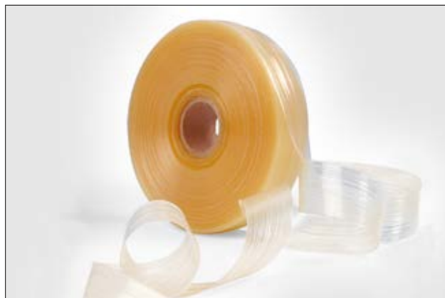
Schmelzklebeband HMT200A zur Abdichtung gegen Feuchtigkeit.