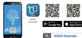
ASUS Extender App

Um die besten Ergebnisse zu erzielen muss sich der RP-AC55 innerhalb der Reichweite eines stabilen Router-Signals befinden und sollte zwischen dem Router und dem Bereich platziert werden, in dem eine bessere Signalabdeckung benötigt wird. Der Asus RP-AC55 bietet die höchste Performance, wenn er ein starkes WLAN-Signal vom Router erhält und dieses weiterleitet. Die Signalstärke kann an der Frontseite des Repeaters getrennt nach Frequenzband abgelesen werden.