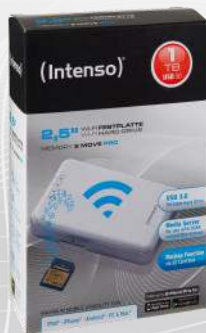
6025861 - 1 TB