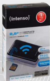
6025860 - 1 TB

6,35 cm (2,5") mobile Festplatte mit Wi-Fi Funktion, Kabelloses Streaming Ihrer Mediensammlung auf Tablet, Smartphone oder PC, Integriertes SD Karten Lesegerät zur direkten Sicherung von Fotos und Videos einer Speicherkarte