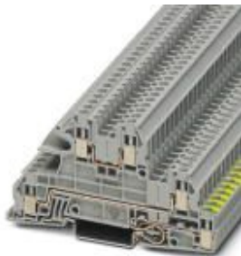
Installationsschutzleiterklemme, Schraubanschluss, Querschnitt: 0,2 mm 2 - 4 mm 2 , AWG: 24 - 12, Breite: 5,2 mm, Farbe: grau, Montageart: NS 35/7,5, NS 35/15

Bitte beachten Sie, dass die hier angegebenen Daten dem Online-Katalog entnommen sind. Die vollständigen Informationen und Daten entnehmen Sie bitte der Anwenderdokumentation. Es gelten die Allgemeinen Nutzungsbedingungen für Internet-Downloads. ( http://phoenixcontact.de/download )