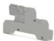
Abschlussdeckel, Länge: 93,5 mm, Breite: 2,2 mm, Höhe: 51,2 mm, Farbe: grau