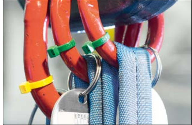
Kabelbinder der T-Serie - ideal zur farblichen Kennzeichnung.