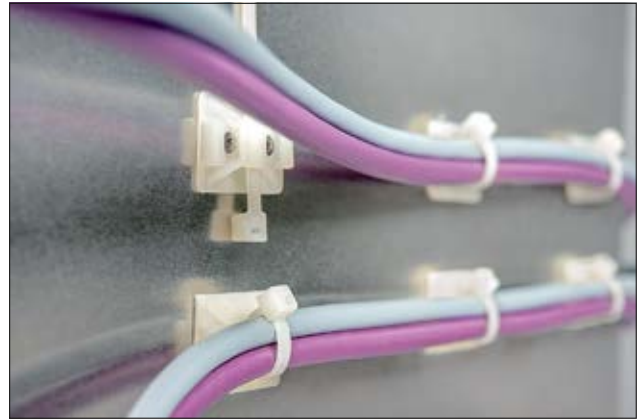
Befestigungssockel der TY-Serie sind als Schraub- oder Klebesockel erhältlich.