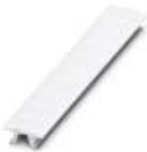
Zackband, bestellbar: streifenweise, weiß, beschriftet nach Kundenangaben, Montageart: verrasten in hoher Schildchennut, für Klemmenbreite: 6,2 mm, Schriftfeldgröße: 6,15 x 10,5 mm, Anzahl der Einzelschilder: 10

Zackband - ZB 6,LGS:FORTL.ZAHLEN - 1051016