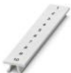
Zackband, Streifen, weiß, beschriftet, beschriftbar mit: CMS-P1-PLOTTER, quer bedruckt: fortlaufende Zahlen 1 ... 10, 11 ... 20 usw. bis 491 ... 500, Montageart: verrasten in hoher Schildchennut, für Klemmenbreite: 6,2 mm, Schriftfeldgröße: 6,15 x 10,5 mm, Anzahl der Einzelschilder: 10

Zackband - ZB 6,QR:FORTL.ZAHLEN - 1051029