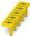
Warnschild, gelb/schwarz, beschriftet: Blitzpfeil, Montageart: stecken, für Klemmenbreite: 6,2 mm