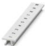
Zackband, Streifen, weiß, beschriftet, beschriftbar mit: CMS-P1-PLOTTER, längs bedruckt: fortlaufende Zahlen 1 ... 10, 11 ... 20 usw. bis 491 ... 500, Montageart: verrasten in hoher Schildchennut, für Klemmenbreite: 6,2 mm, Schriftfeldgröße: 6,15 x 10,5 mm, Anzahl der Einzelschilder: 10

Zackband - ZB 6,LGS:FORTL.ZAHLEN - 1051016