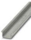
Tragschiene ungelocht, Standardprofil 2,3 mm, Breite: 35 mm, Höhe: 15 mm, nach EN 60715, Material: Stahl, verzinkt, dickschichtpassiviert, Länge: 2000 mm, Farbe: silberfarben

Tragschiene ungelocht - NS 35/15-2,3 UNPERF 2000MM - 1201798