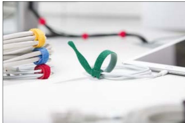
Durch das praktische Kabelbinderdesign kann der TEXTIE am Kabel verbleiben und geht nicht verloren.