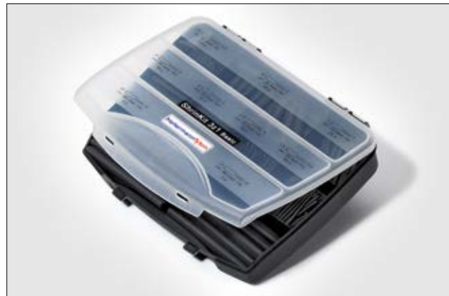
ShrinKit 321 Basic.