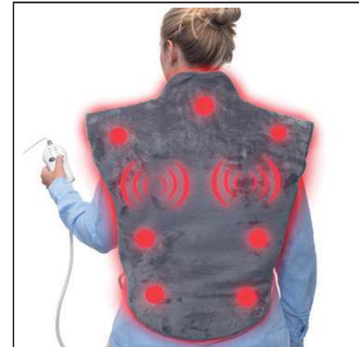
3 heating settings and 6 vibrating massage levels