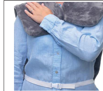
Easy attachment by means of clip closure at the front