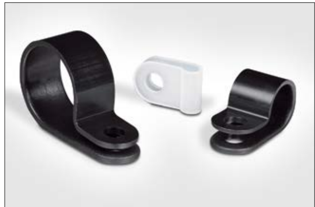
Die Kunststoffschellen der HP-Serie sind in verschiedenen Größen erhältlich.